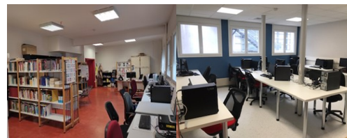
Centre de documentation