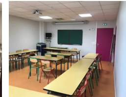
Salle de cours