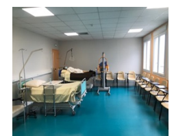
Salle de TP