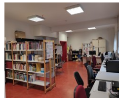
Centre de documentation