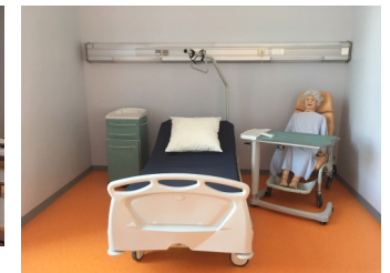
Salle de TP