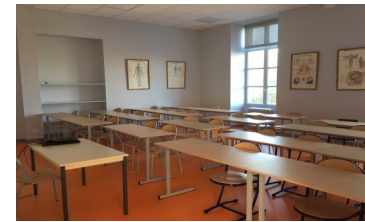
Salle de cours