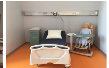
Salle de TP