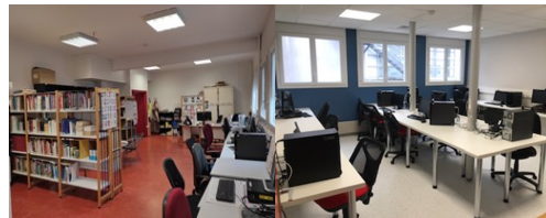
Centre de documentation