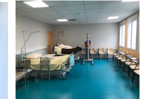
Salle de cours