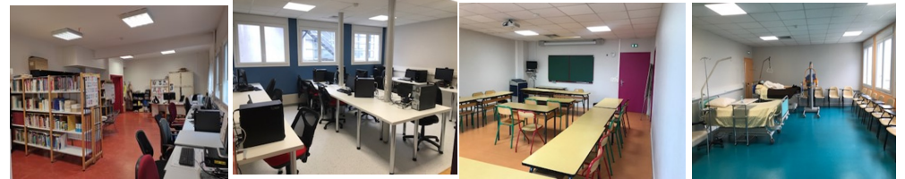
Centre de documentation