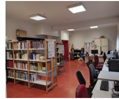
Centre de documentation